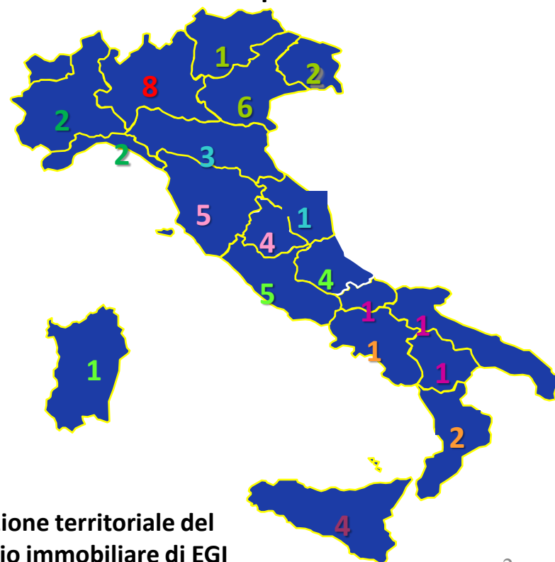
Dislocazione territoriale del portafoglio immobiliare di EGI